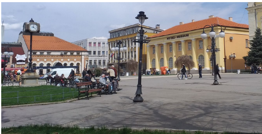
Zaječar, centar grada

Zaječar dodelio je najveći deo — 1.208.000 dinara. Ovi mediji uglavnom preuzimaju informacije sa opštinskih sajtova.