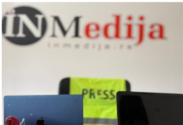
IN Medija, Indija

i pravnim napadima. U januaru je redakcija dobila pretnje smrću putem komentara na sajtu. Najteži incident dogodio se 26. februara, kada je muškarac fizički napao ekipu tokom protesta, uz uvrede, a policija je intervenisala. U aprilu je hakovan Instagram nalog i izgubljena dvogodišnja arhiva; nalog je vraćen u junu, ali je u međuvremenu otvoren bekap naloga. U julu i novembru stigle su tri SLAPP presude u ukupnom iznosu od 495.150 dinara. U avgustu su prijavljene nove ozbiljne onlajn pretnje VTK-u, dok je u septembru ruska služba SVR objavila spisak medija koji navodno organizuju „Srpski Majdan“, među kojima je i IN Medija, što je izazvalo dodatne pretnje.