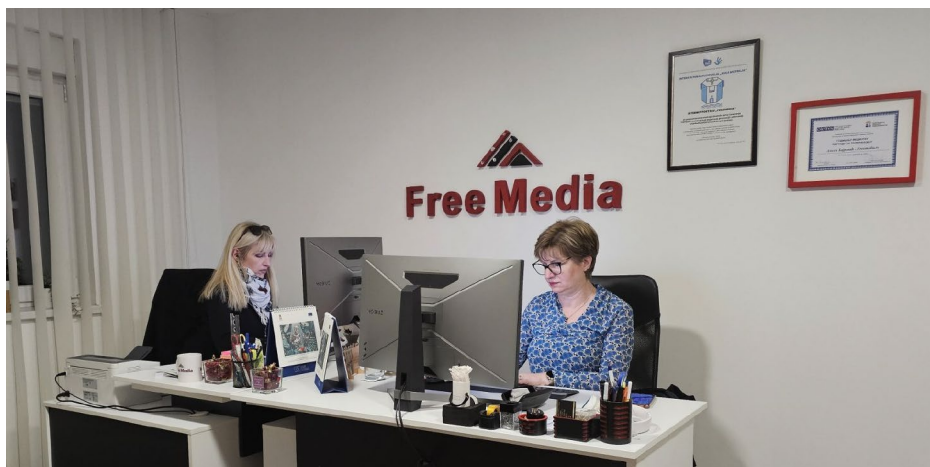
Deo redakcije portala Free Media

Međutim, situacija se nije promenila, što je dovelo do novog razočarenja, ali i sumnje u novi način bodovanja komisije. Na primer, Televizija Sandžak je na tom konkursu sa 89 bodova dobila milion i po dinara, a Radio televizija Novi Pazar 20 puta više novca, iako je imala samo šest bodova više.