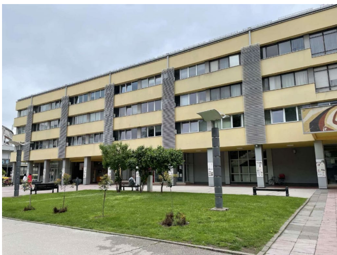
Zgrada Grada Kraljeva

RTV Vrnjačka Banja dobila je ukupno 1.200.000 dinara — 800.000 za projekat „Manastiri crkve, crkve brvnare i crkve preletačice Eparhije žičke“ i 400.000 za projekat „Kulturni detoks“. Vlasnik je Milan Vlasisavljević, poslanik SNS-a u Skupštini AP Vojvodine, predsednik Odbora za administrativna i mandatna pitanja i član Odbora za bezbednost. Vlasnik je firme “Vita asistent” i hotela “Fontana” u Vrnjačkoj Banji. O njemu je pisao Krik u tekstu „Rasprodaja u Vrnjačkoj Banji: 2,5 miliona evra SNS biznismenima da srede hotele“ (06.08.2019). Na sajtu rtvvrnjackabanja.com ne mogu se pronaći sadržaji na kojima je naznačeno da su finansirani novcem iz budžeta Grada Kraljeva.