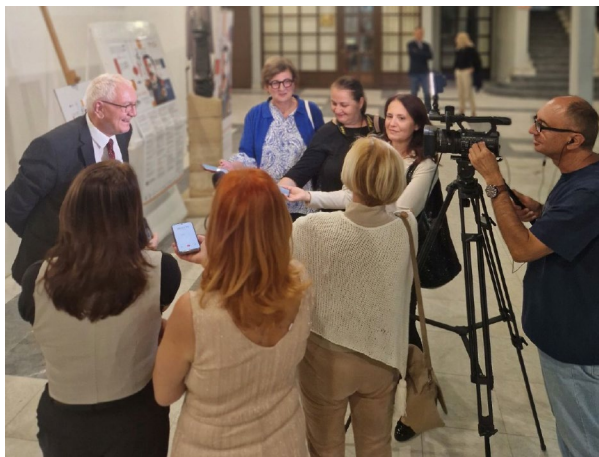
Medijske ekipe na terenu

U istom periodu, sve lokalne samouprave u ova dva okruga podelile su ukupno 51.443.500 dinara putem medijskih konkursa. Zanimljivo je da najviše sredstava izdvaja opština Knjaževac (12 miliona dinara), zatim opština Negotin (10 miliona). Gradovi Bor i Zaječar dodeljuju nešto više od 7 miliona, dok je iznos u opštini Boljevac najmanji — 2,5 miliona dinara.