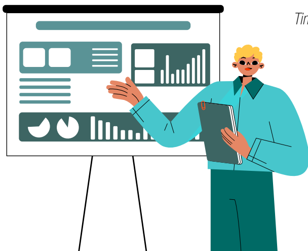
Tim Res Publike

Kombinovanjem analitičkog pristupa i novinarskih tekstova sa terena, na jednoj i konsultovanja lokalnih medijskih aktera na drugoj strani, Res Publika je želela ne samo da konstatuje postojeće stanje, već i da doprinese njegovom boljem razumevanju i otvori dodatni prostor za argumentovanu javnu diskusiju o budućnosti medija i slobode informisanja u lokalnim zajednicama.